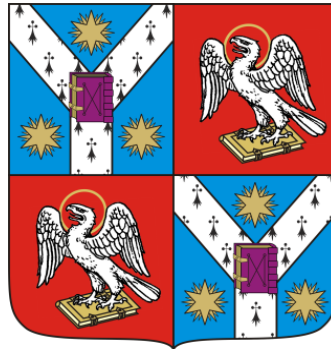
FACULTATEA DE LITERE