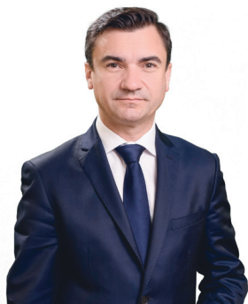
Mihai Chirica Maire de la ville de Iași