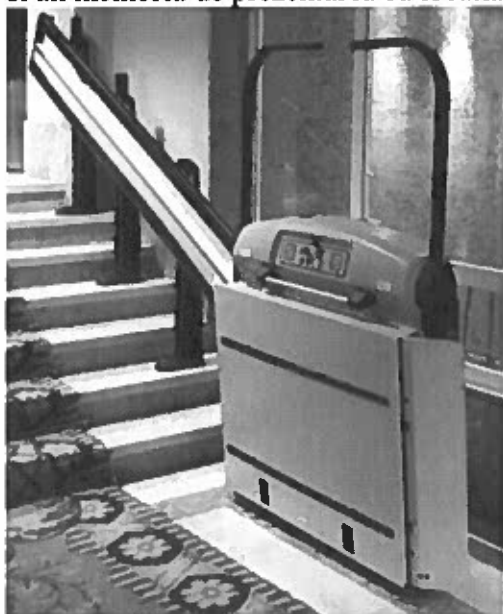
Fig 2 imagine cu titlu informativ privind platforma nedeplasabilă

Documentația pentru obținerea autorizării este compusă din documentația tehnică a echipamentului și un memoriu de prezentare cu locația (asimilat proiect)