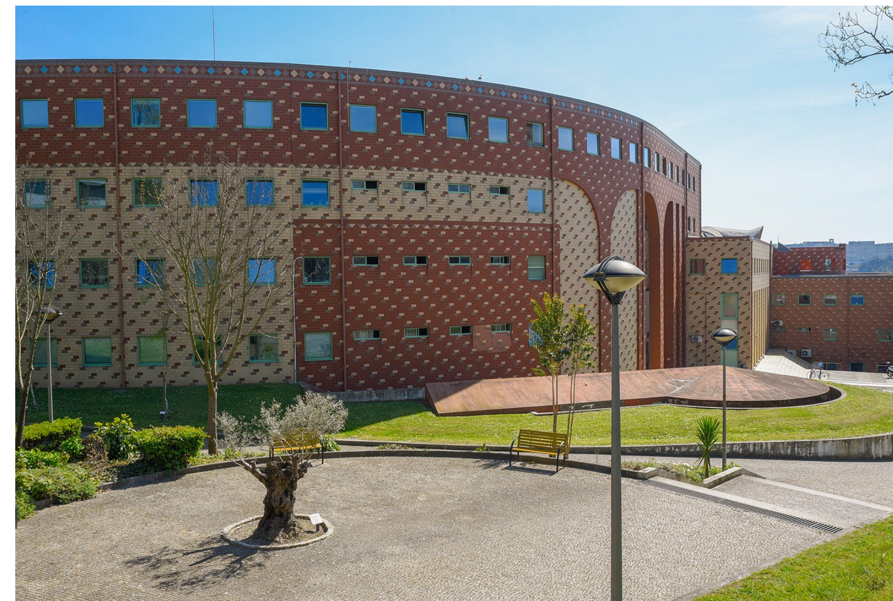
Faculdade de Letras da Universidade do Porto https://sigarra.up.pt/flup/pt/web_page.inicial