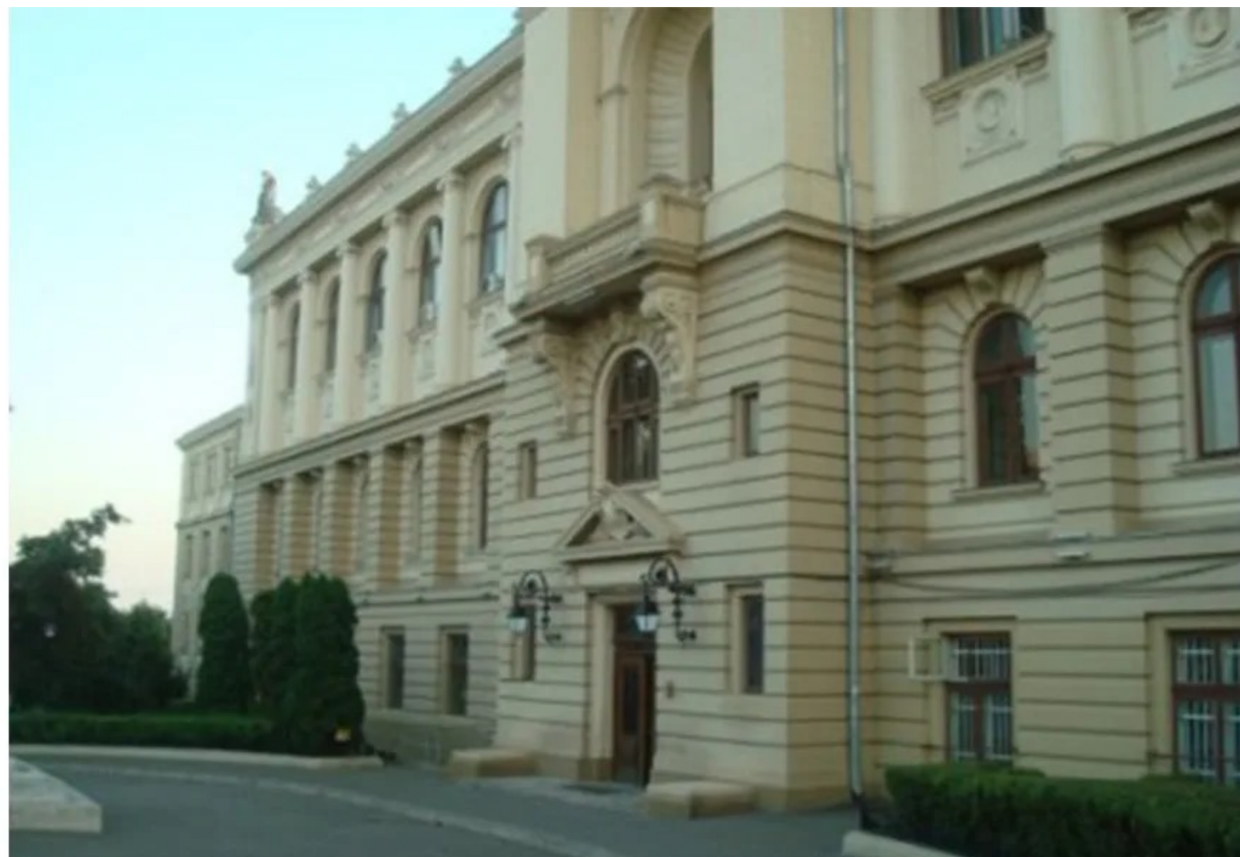
Facultatea de Litere a Universității „Alexandru Ioan Cuza” din Iași https://litere.uaic.ro