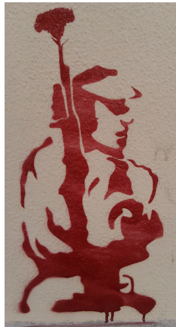
IsmailKupeli - Carnation Revolution / Revolução dos Cravos Uploaded by JotaCartas [3.IV.2024]

11:15-11:30 (9h15-9h30 Portugal) Concluzii / Conclusões